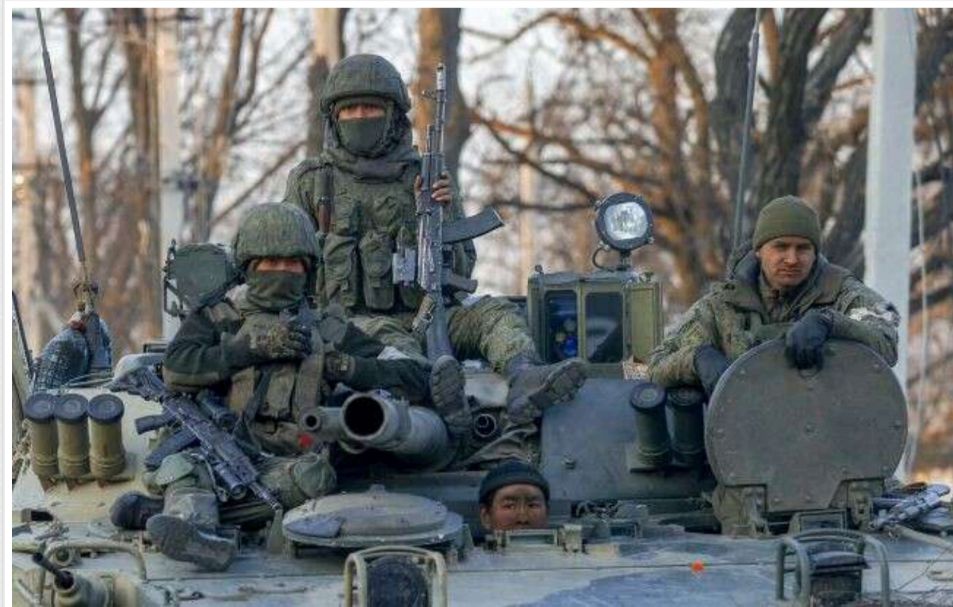
Окупанти із 70-го МСП бунтують і відмовляються виконувати накази

У складі 70-го мотострілецького полку армії РФ, яка бере участь у бойових діях на Запоріжжі, назріває бунт. Випадки непокорі солдатів і сержантів їхнім керівникам там стають все частішими.