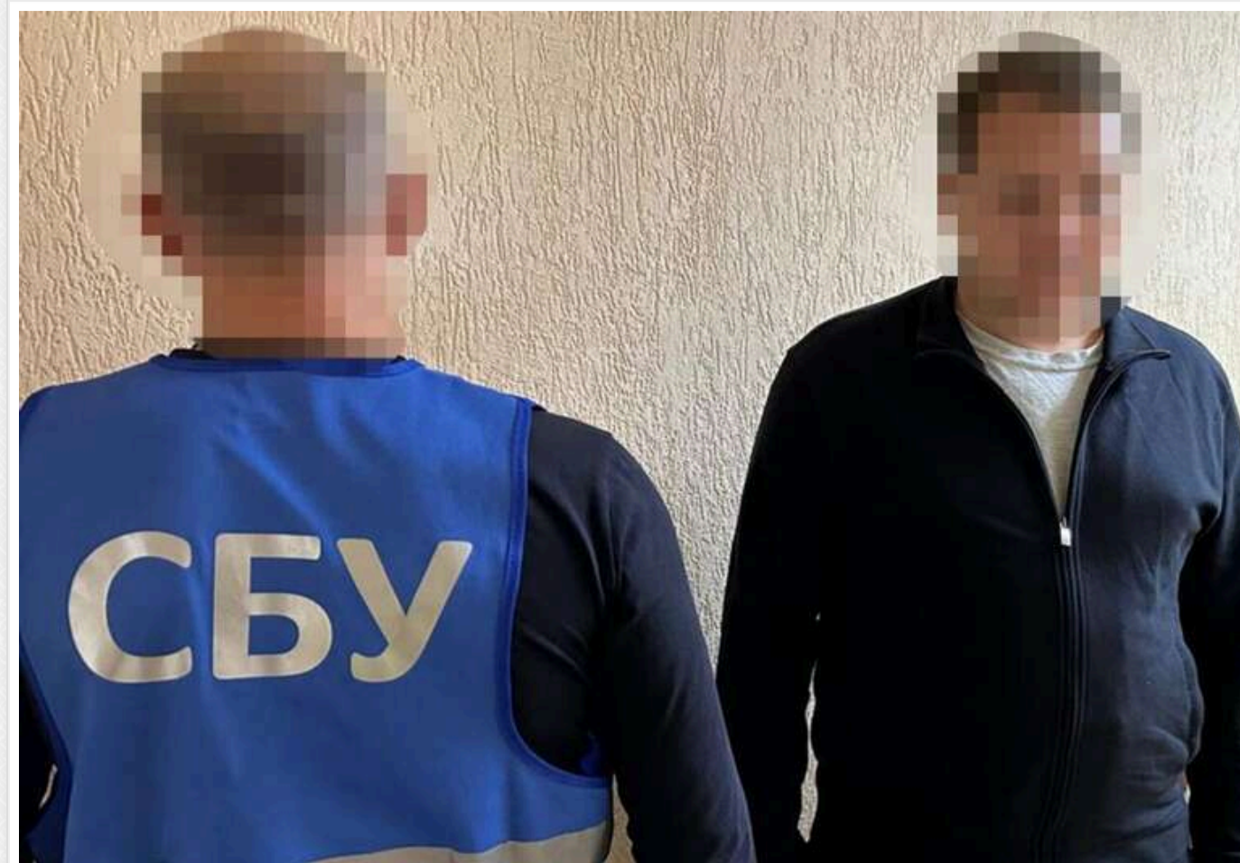
У Київській області співробітники коледжу організували схему ухилення від мобілізації

У Київській області співробітники СБУ розкрили заступника директора фінансового коледжу та двох його підлеглих, які організували схему ухилення від мобілізації. Вони заднім числом оформлювали чоловіків до аспірантури, що давало можливість на відстрочку та виїзд за кордон.