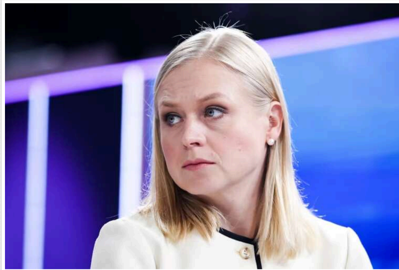
Західні країни втомилися підтримувати Україну та сподіваються на врегулювання війни, – Валтонен

Країни Заходу відчувають втому в питанні допомоги Україні і все більше сподіваються на врегулювання війни з Росією в будь-якій формі, зазначила міністр закордонних справ Фінляндії Еліна Валтонен.