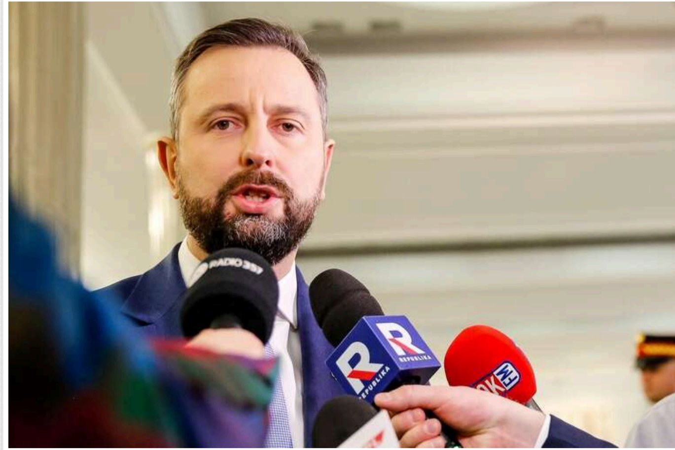
Поляки незадоволені тим, як українська молодь живе в Польщі на широку ногу, - Косіняк-Камиш

Багато поляків невдоволені тим, як українська молодь живе в Польщі на широку ногу в умовах війни, зазначив польський міністр оборони Владислав Косіняк-Камиш.