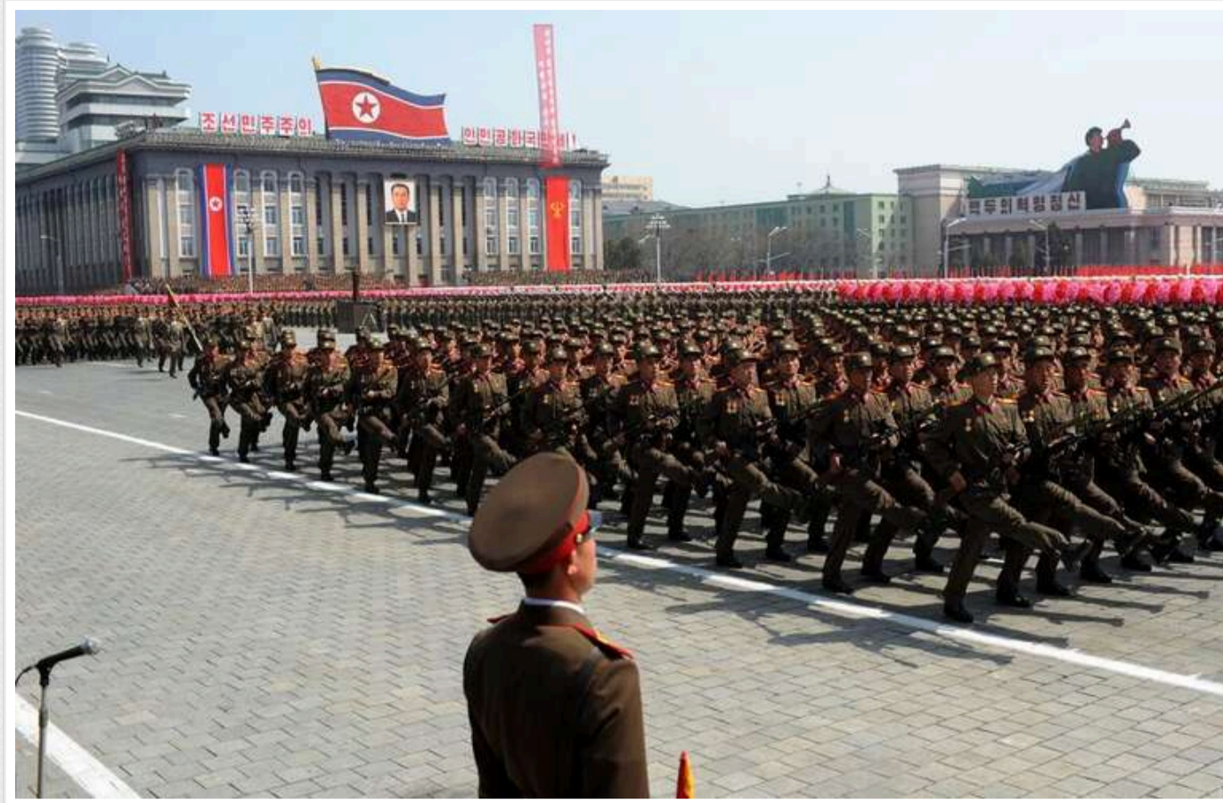
У РФ формують «особливий бурятський батальйон» із військових КНДР

У російській окупаційній армії на базі 11-ї окремої десантно-штурмової бригади формується "особливий бурятський батальйон". Він укомплектований військовими з Північної Кореї.