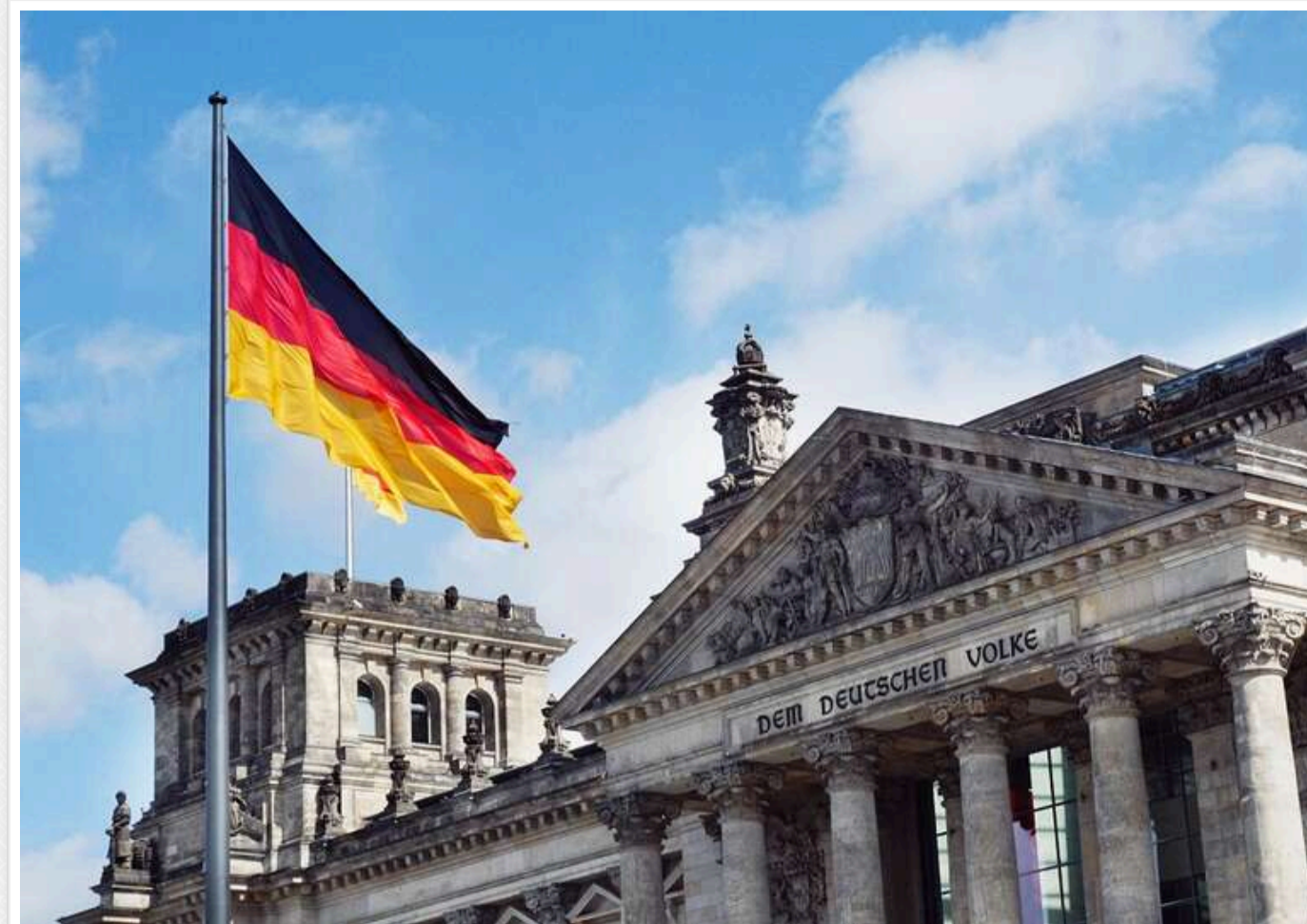
Німецька молодь побоюється можливості поширення війни в Україні Європою, - DW

Найбільші побоювання у німецької молоді (12-25 років) викликає можливість поширення війни в Україні Європою, повідомляє DW, посилаючись на опитування, проведене на замовлення нафтової компанії Shell.