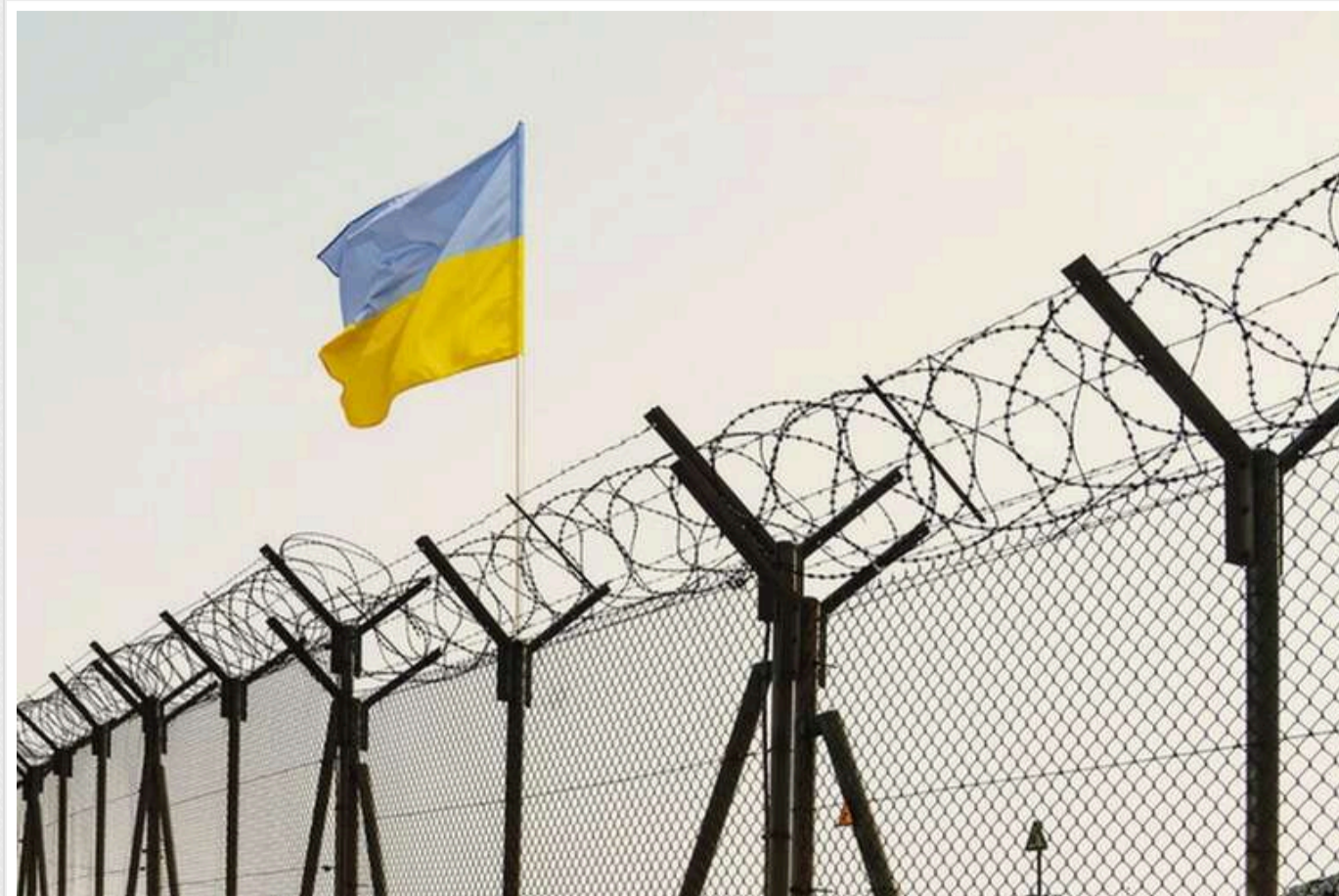
В Україні ув'язненим можуть дозволити виїжджати з колоній на короткий термін

В Україні можуть надати дозвіл в'язням на тимчасовий виїзд з колоній. Так, урядом було підтримано законопроект "Про внесення змін до Кримінально-виконавчого кодексу України у зв'язку з рішенням Конституційного суду України від 20 грудня 2023 року".