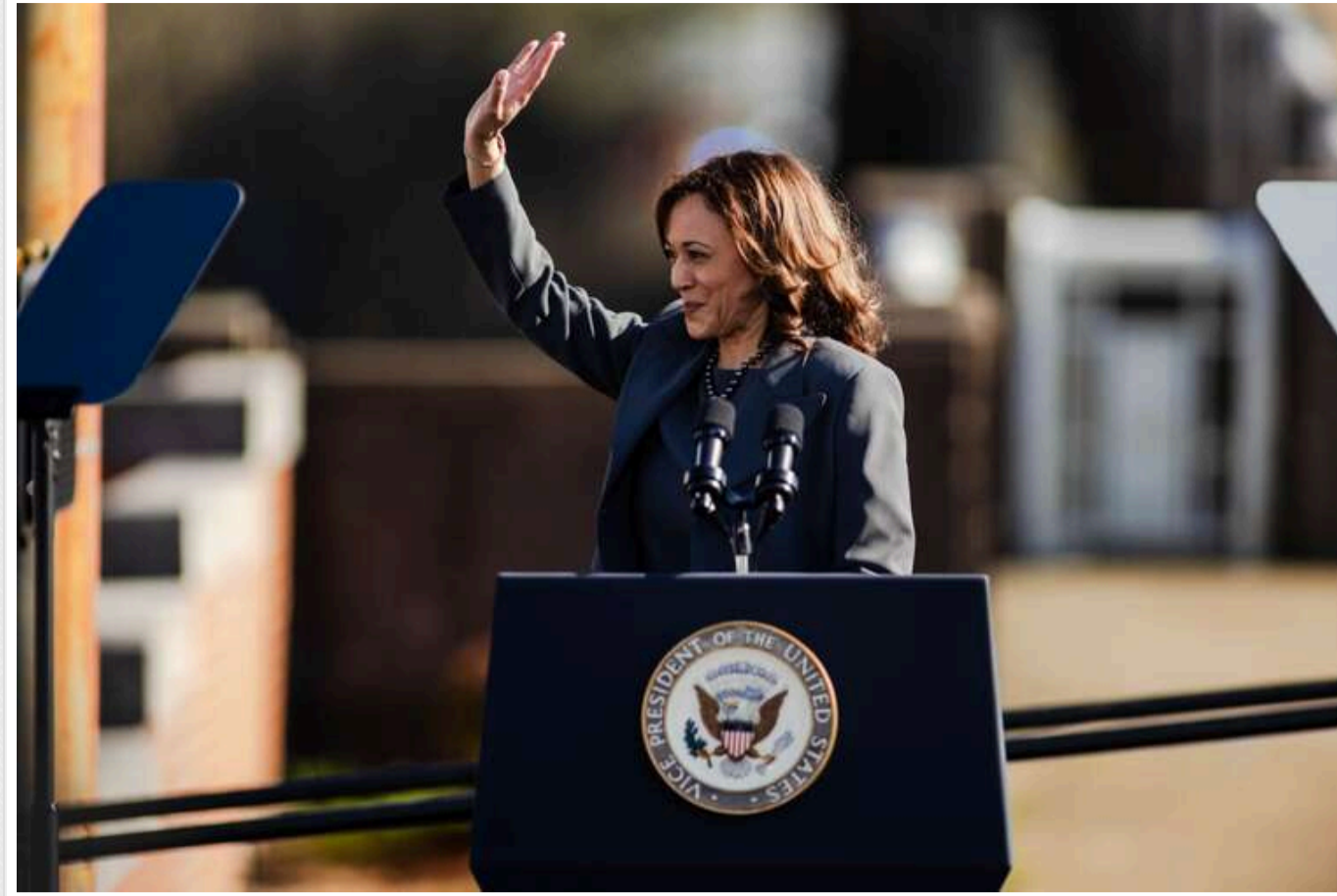
Газета New York Times почала докоряти Гарріс за недостатньо активну передвиборчу кампанію

Газета New York Times, яка раніше підтримувала Камалу Гарріс, почала критикувати її за недостатню активність у передвиборній кампанії.