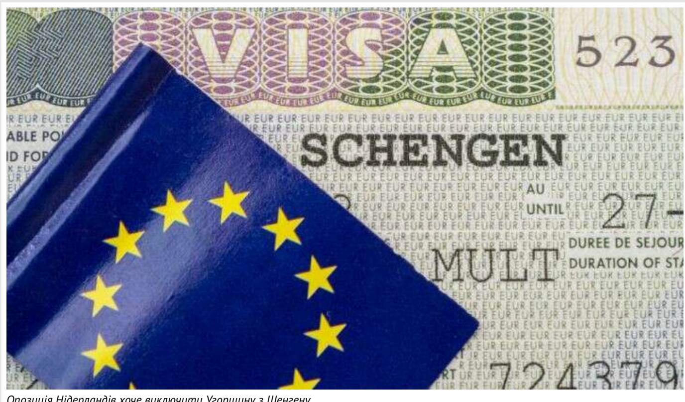
Опозиція Нідерландів хоче виключити Угорщину з Шенгену

У Нідерландах опозиційні партії D66 і CDA хочуть тимчасово виключити Угорщину з Шенгенської зони, заявляючи, що країна пропускає занадто багато росіян без перевірок.