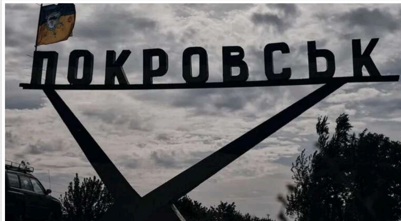
Жителі Покровська розповіли, чому не залишають місто й як живуть під постійними обстрілами

У місті Покровськ, яке постійно зазнає обстрілів, місцеві мешканці діляться своїми страхами та надіями. Багато хто з них вирішив залишитися вдома, попри небезпеку.