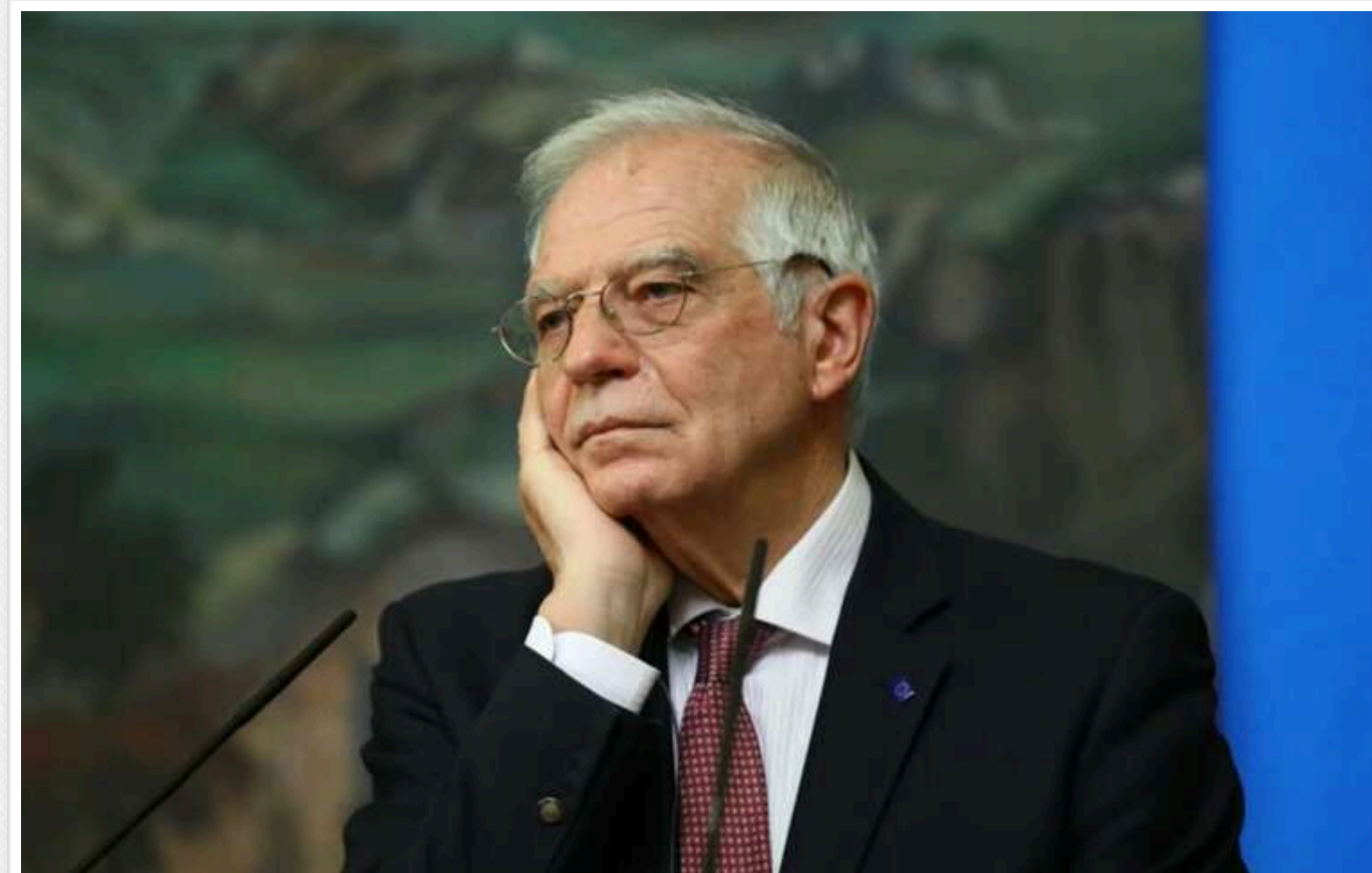
Боррель зазначив, що ситуація перед виборами в Грузії є більш гнітючою, ніж у Молдові

Верховний представник ЄС із закордонних справ та політики безпеки Жозеп Боррель заявив, що ситуація перед виборами у Грузії викликає більше занепокоєння, ніж у Молдові. Обидві країни прагнуть приєднатися до ЄС. Про це повідомляє « Ехо Кавказа ».