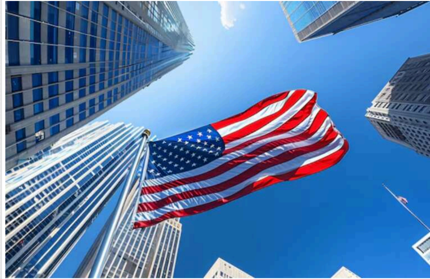
Bloomberg: США обдумують варіант щодо обмеження експорту чипів для ШІ до країн Перської затоки

Адміністрація президента США Джо Байдена розглядає можливість обмеження продажу ШІ-чипів від американських компаній до окремих країн.