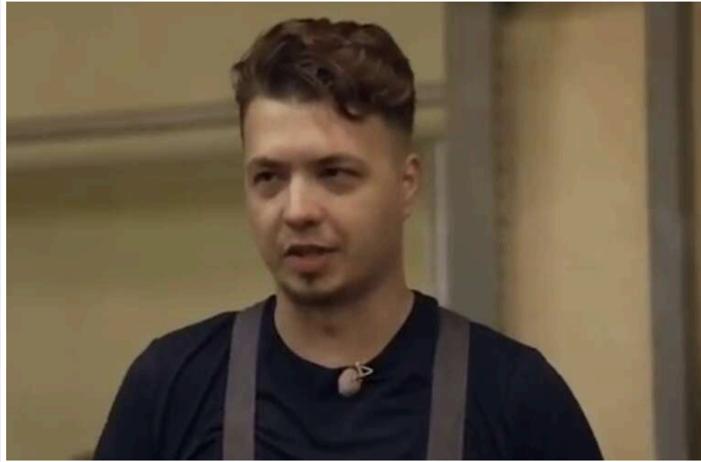
Колишній опозиційний білоруський журналіст Роман Протасевич тепер працює зварювальником на заводі в Мінську