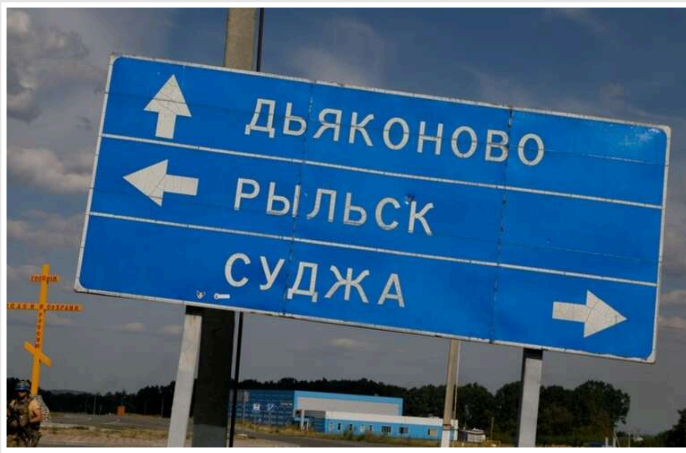
ISW: Війська РФ перебувають за 7 кілометрів від околиць Суджі

Окупаційна армія РФ продовжує контрнаступ у Курській області та намагається повернути під свій контроль територію. Протягом доби, 14 жовтня, загарбники відбили територію на головному українському виступі в Курській області.