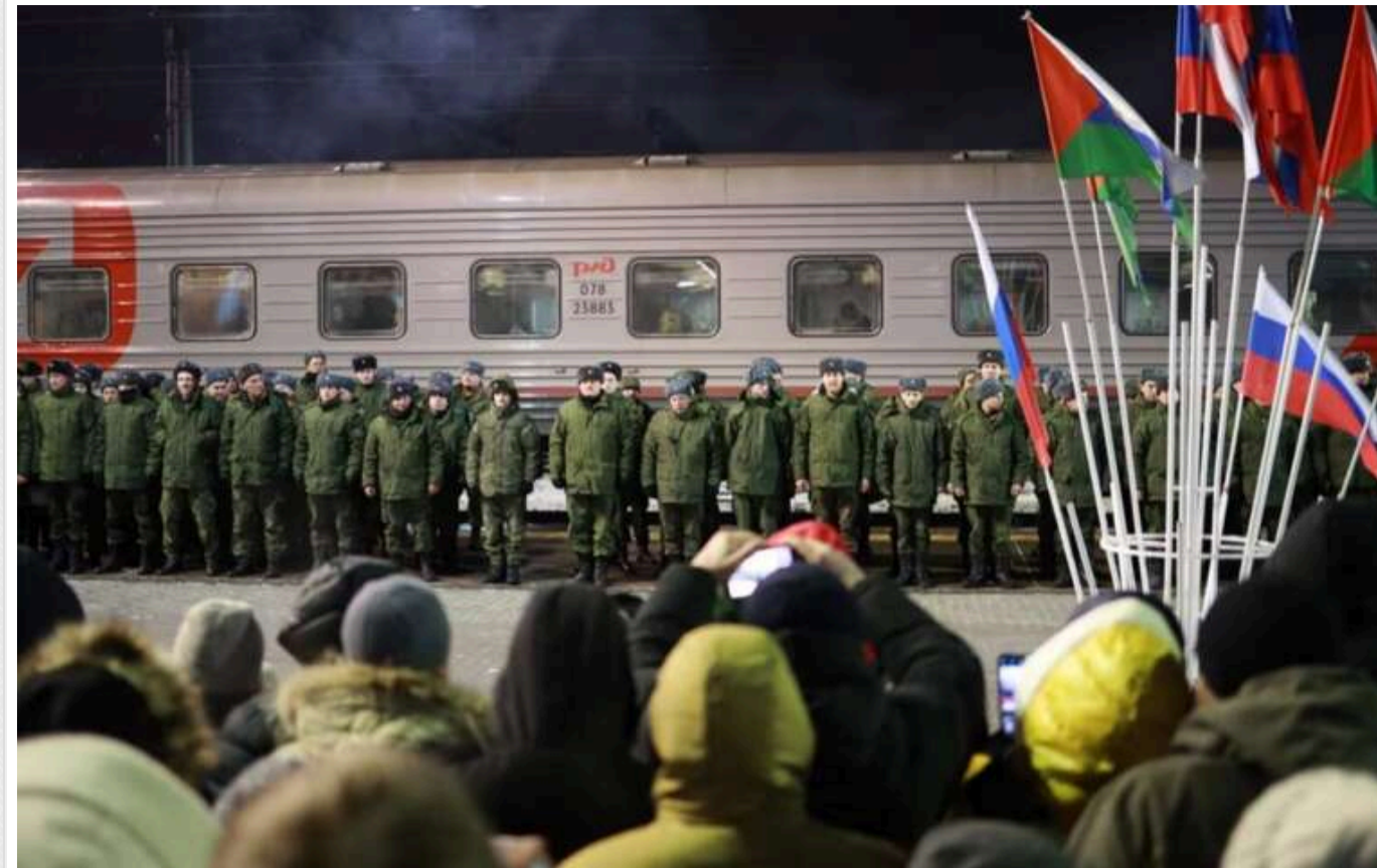
В РФ мігрантів із Центральної Азії, які опинилися в колоніях, змушують йти на війну проти України

Країна-агресорка Росія продовжує вербувати на війну проти України ув'язнених у російських тюрмах та колоніях. На фронт забирають не тільки громадян РФ, а й вихідців із країн Центральної Азії та інших іноземців.