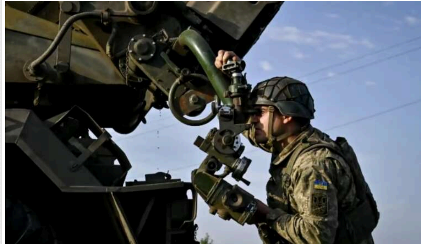
Втрати ворога: Сили оборони знешкодили ще 1210 окупантів та 44 броньовані машини

Сили оборони продовжують завдавати втрат Росії, країні-агресорці – лише за минулу добу знищено 1 210 окупантів, 13 танків, 44 ББМ та 9 артсистем.