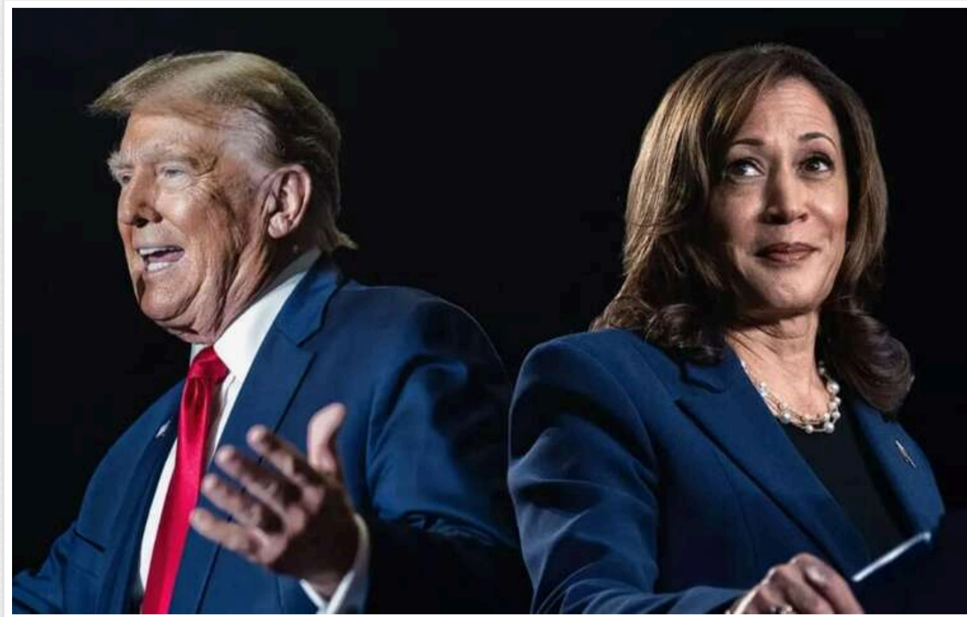
У США на достроковому голосуванні в штатах, що вагаються, Трамп випереджає Гарріс, - ЗМІ

Трамп має невелику перевагу над Гарріс серед виборців, які голосують достроково в штатах, що коливаються. Це є обнадійливим знаком для республіканців.