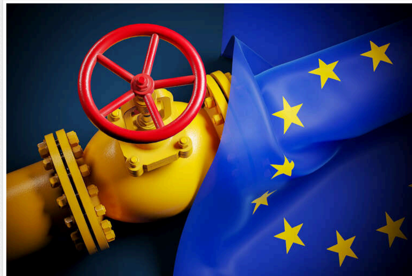
Bloomberg: В ЄС розглядають два можливих підходи для збереження транзиту газу через Україну

Міністри енергетики Європи будуть обговорювати імпорту російського природного газу, який продовжує надходити до регіону, попри те, що війна в Україні триває вже третю зиму. Розглядаються два варіанти, але угода ще не досягнута.