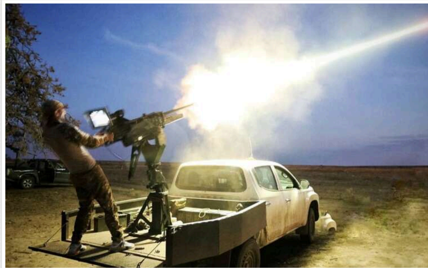
Підрозділи протиповітряної оборони цієї ночі збили 12 із 17 дронів

Чотири російські безпілотники зникли в невідомому напрямку, один залишився в повітрі.