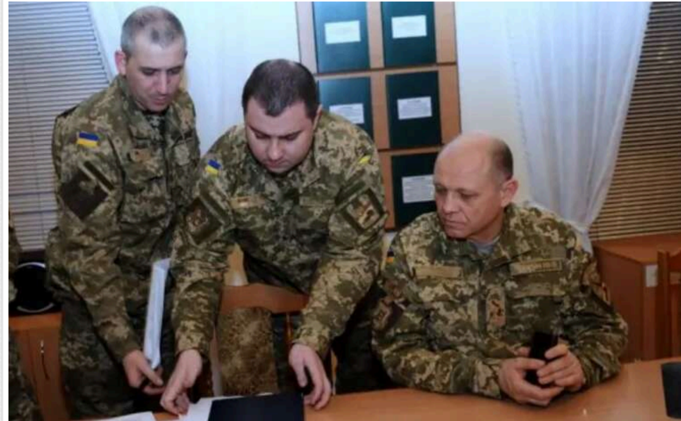
У Волинській області перевіряють "критичність" компаній, що резервують працівників від мобілізації

В ОВА повідомили, що випадки зловживання в регіоні є, та назвали це не припустимим. Українці, чіх роботодавці викриють на зловживаннях, втратять свої відстрочки.