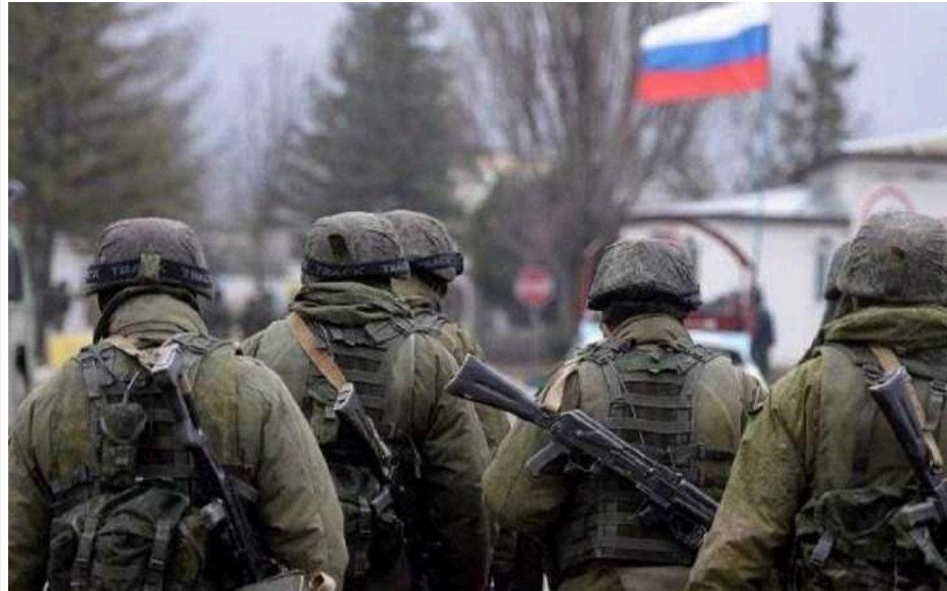
У The Times розкрили "тактику м'ясорубки" російських окупантів

Російські загарбники за останні два місяці захопили понад 823 квадратних кілометри української території, чого не було з 2022 року.