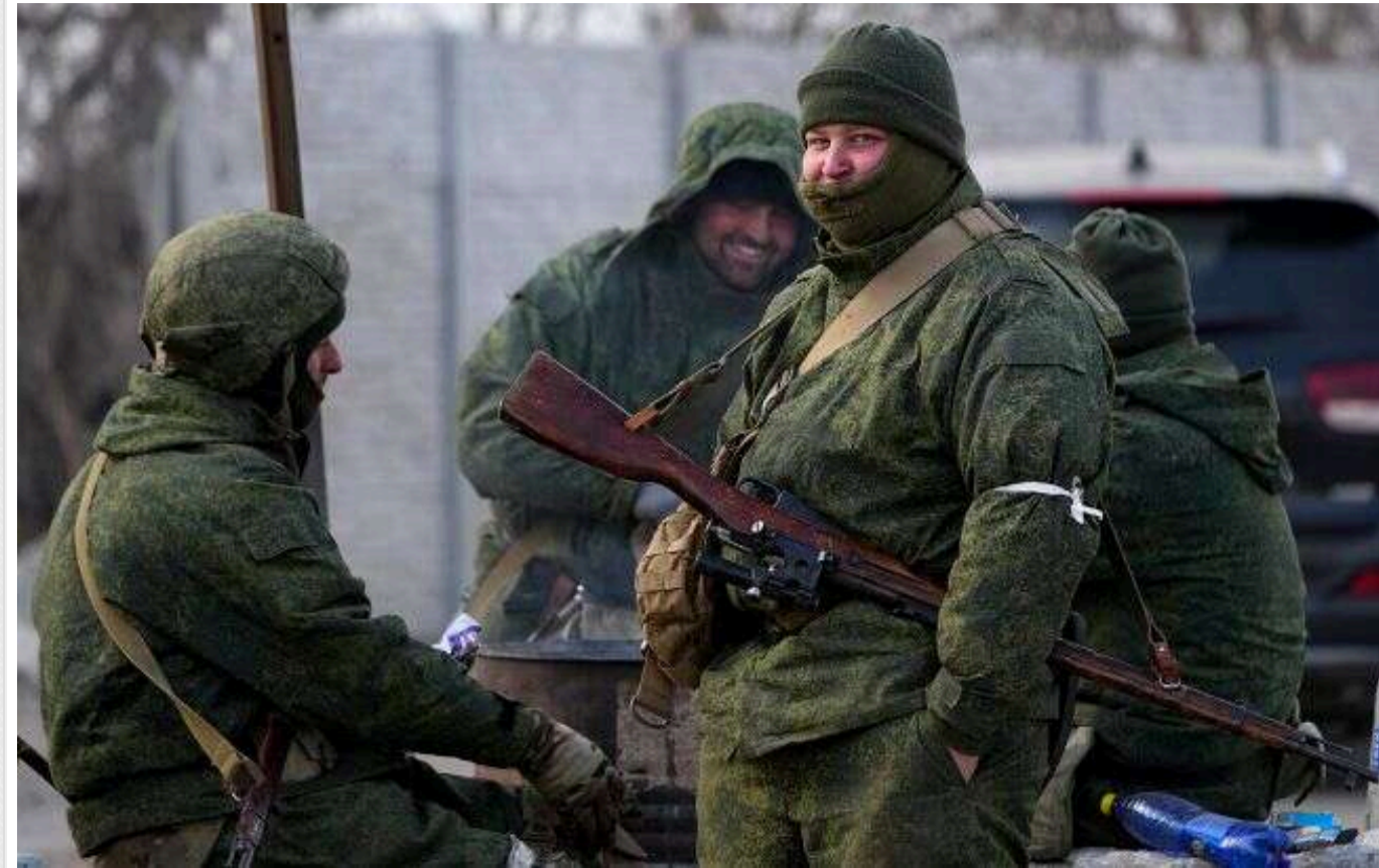
Росія використовує раритетні гармати Д-74, які СРСР подарував В'єтнаму та КНР, - ЗМІ

Російська армія, ймовірно, обстрілює українські позиції в Донецькій області з 122-мм гармати Д-74. Вона була розроблена в Радянському Союзі наприкінці 1940-х років.