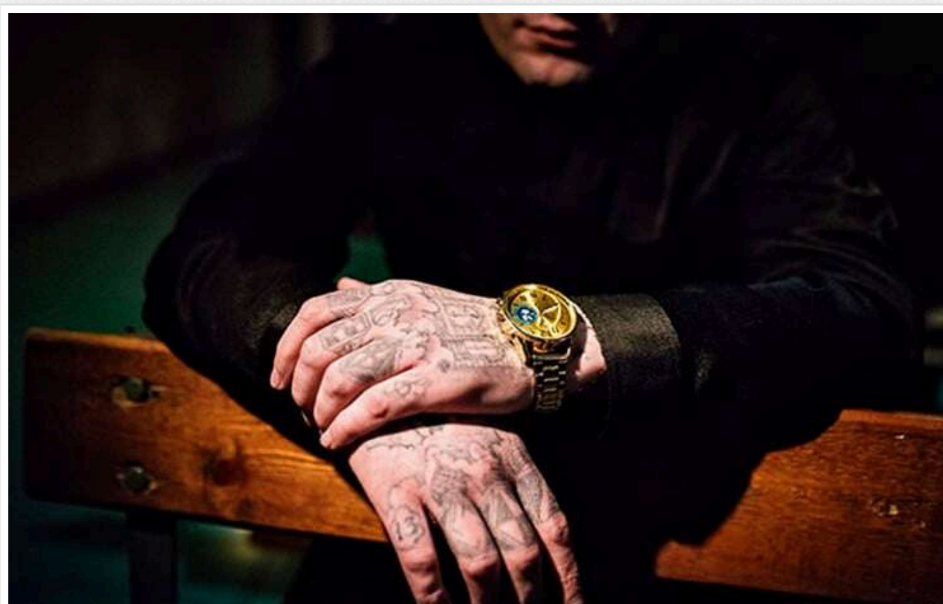
ЗМІ назвали кількість "злочинів в законі", які залишилися в Україні

В кінці літа та на початку осені 2024 року в Україні вийшли двоє представників найвищої касты кримінального світу - "злочинів в законі" Мамука Оніані ("Мамука") та Паата Чхартішвілі ("Принц").