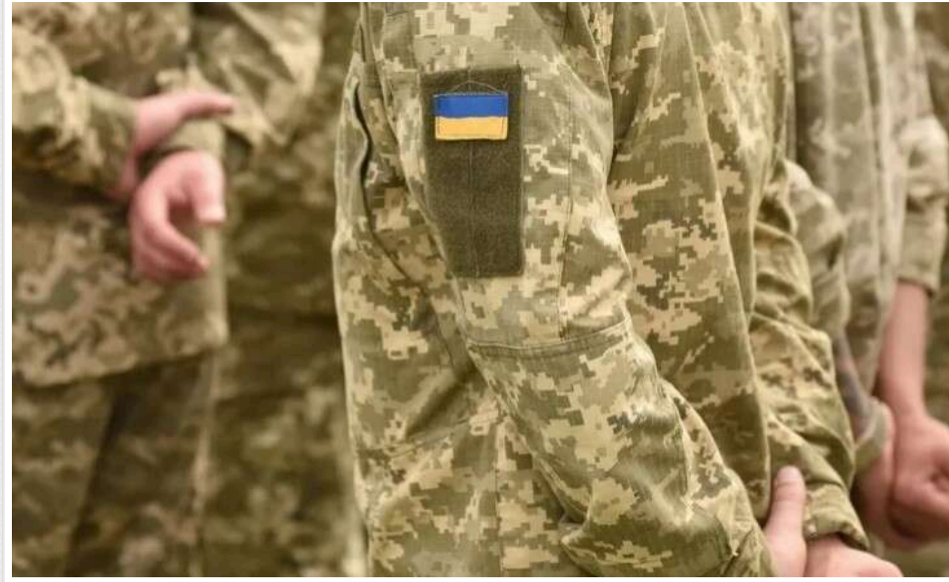
Депутат повідомив, скільки українців не поновили обліково-військові дані в ТЦК

У 2024 році понад шість мільйонів військовозобов'язаних в Україні не виконали свій обов'язок щодо оновлення даних у територіальних центрах комплектування (ТЦК). А мобілізаційні рейди ТЦК пов'язані з проханнями бойових командирів, які потребують поповнення своїх підрозділів.