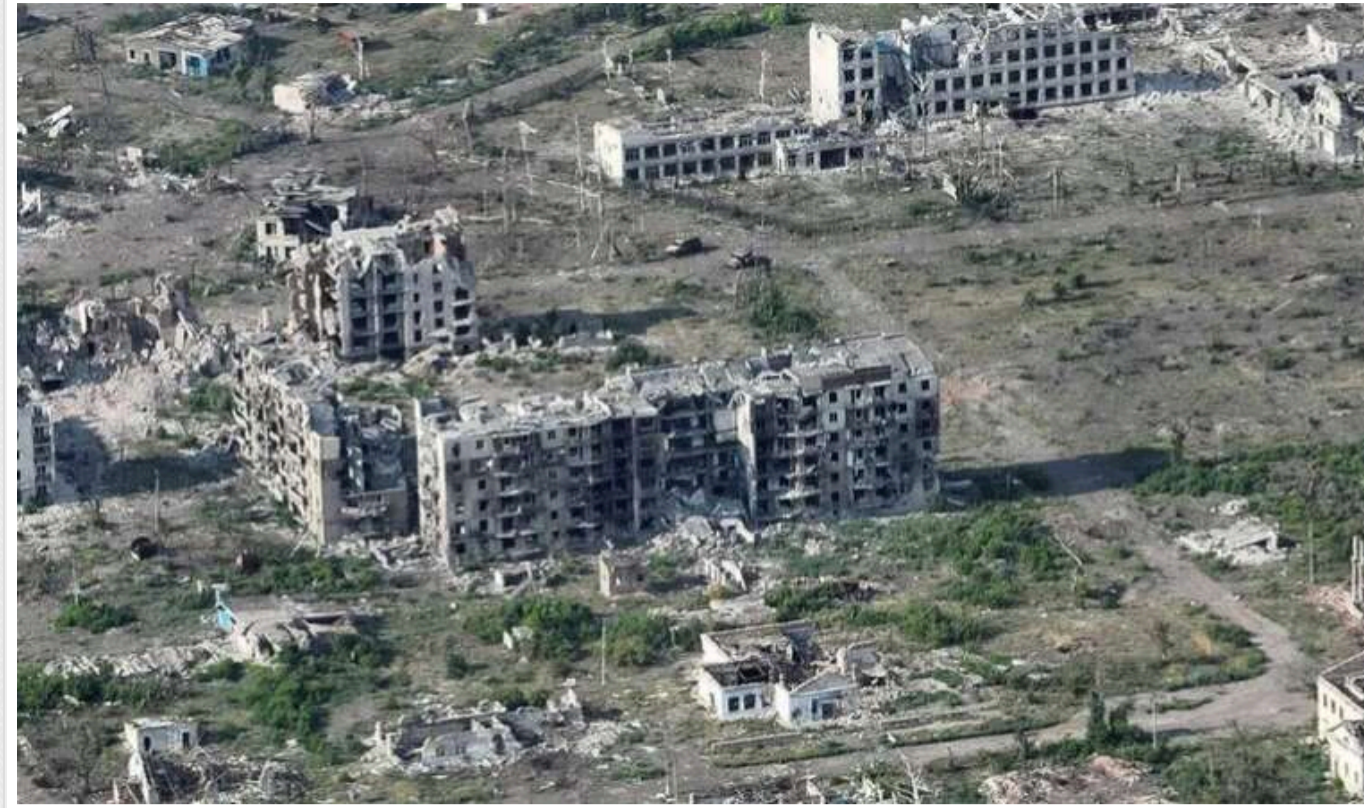
У Збройних Силах України заявили про "вкрай важку" ситуацію в Часовому Яру

Російська окупаційна армія продовжує активний наступ на Краматорському напрямку і намагається захопити Часів Яр. При цьому загарбники використовують звичну для себе тактику терору та зрівнюють місто із землею.