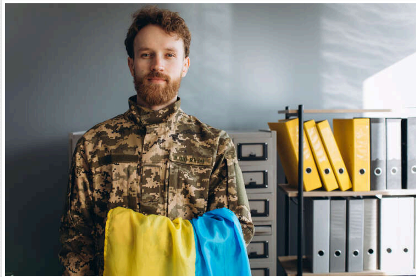
Український бізнес останніми тижнями відчуває труднощі з продовженням статусу «критичної інфраструктури» для бронювання працівників