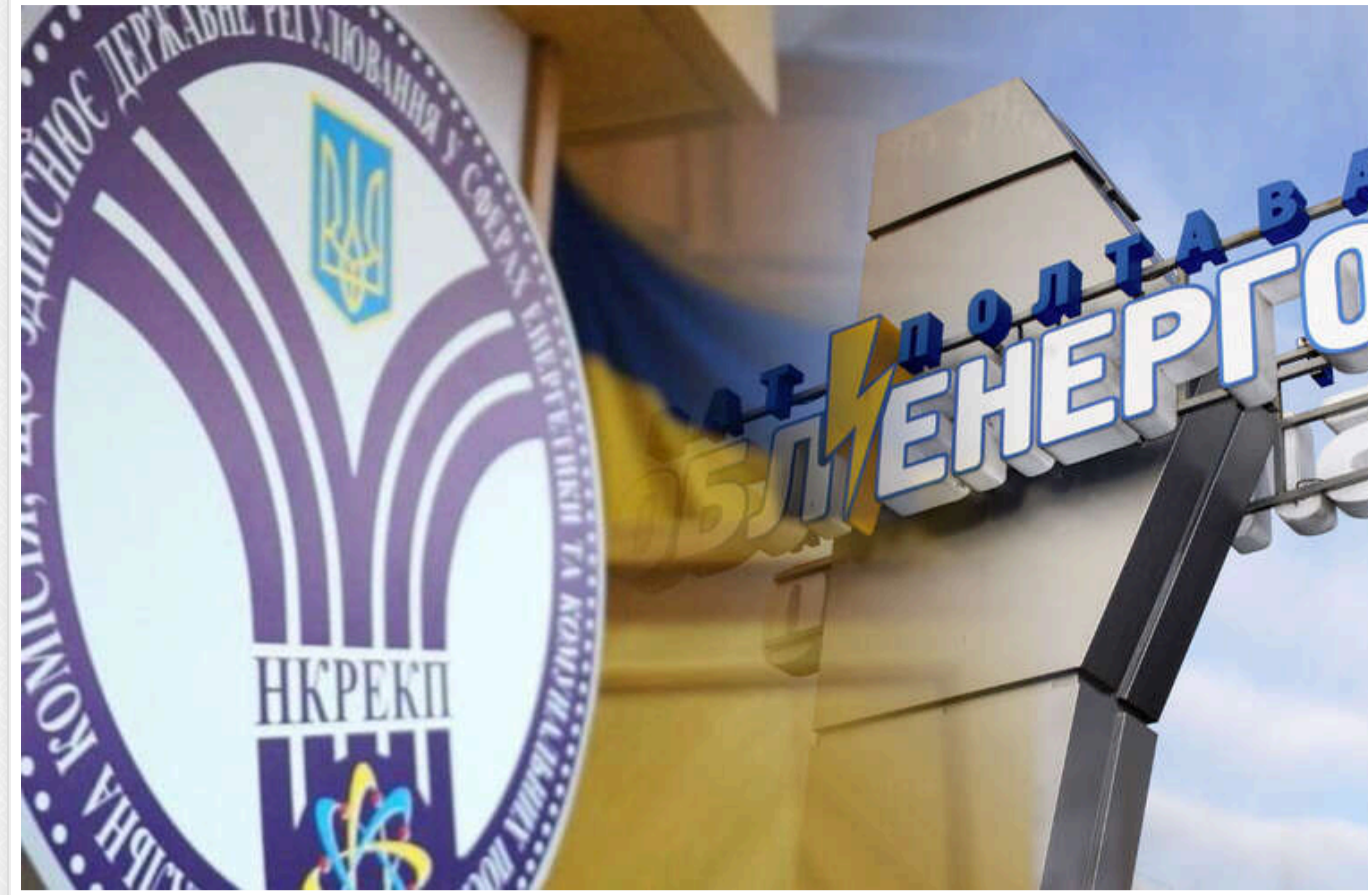
У НКРЕКП запевнили, що підстав для зупинення імпорту електроенергії немає

Національний енергорегулятор НКРЕКП відкидає можливість припинення сертифікації НЕК "Укренерго" як незалежного оператора системи передачі (ОСП) за моделлю ISO, а також пов'язану з цим загрозу для імпорту електроенергії.