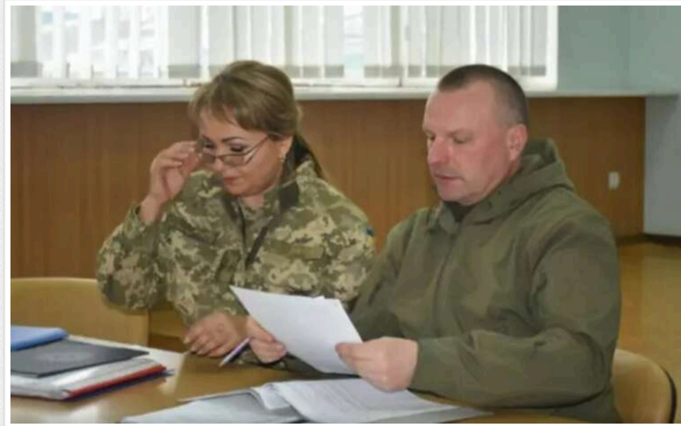
Столичний ТЦК витратить майже 3 мільйони гривень на календарі та бланки