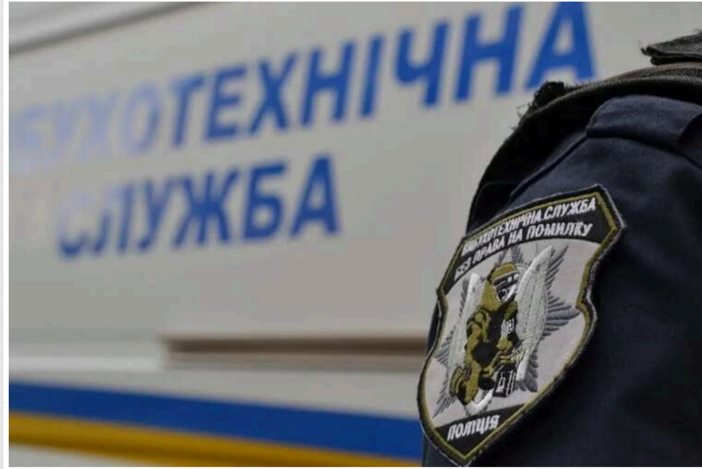
Міністр МЗС доручив посилити заходи безпеки для дипломатів і дипустанов після листів про замінування

У понеділок, 14 жовтня, понад шість десятків закордонних дипломатичних установ України отримали анонімні повідомлення про мінування будівель; кількість таких повідомлень зростає. Схожі повідомлення отримали і підрозділи МЗС України.