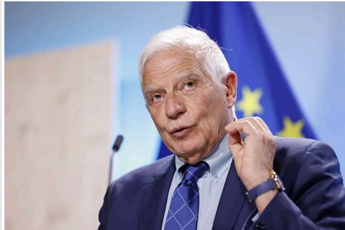
Боррель: Президент Зеленський представить План перемоги Україні лідерам ЄС

На наступній Європейській Раді за участю лідерів держав та урядів країн ЄС Президент України Володимир Зеленський представить український План перемоги.