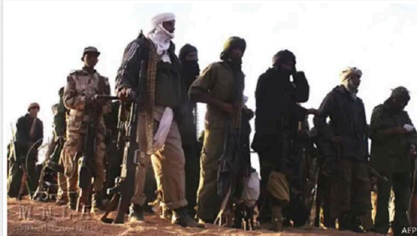
Le Monde: Україна відправляє БПЛА в Малі для протистояння з ПВК "Вагнер"

За інформацією видання, завдяки українським безпілотникам у повстанців також є можливість бити ворога з повітря.