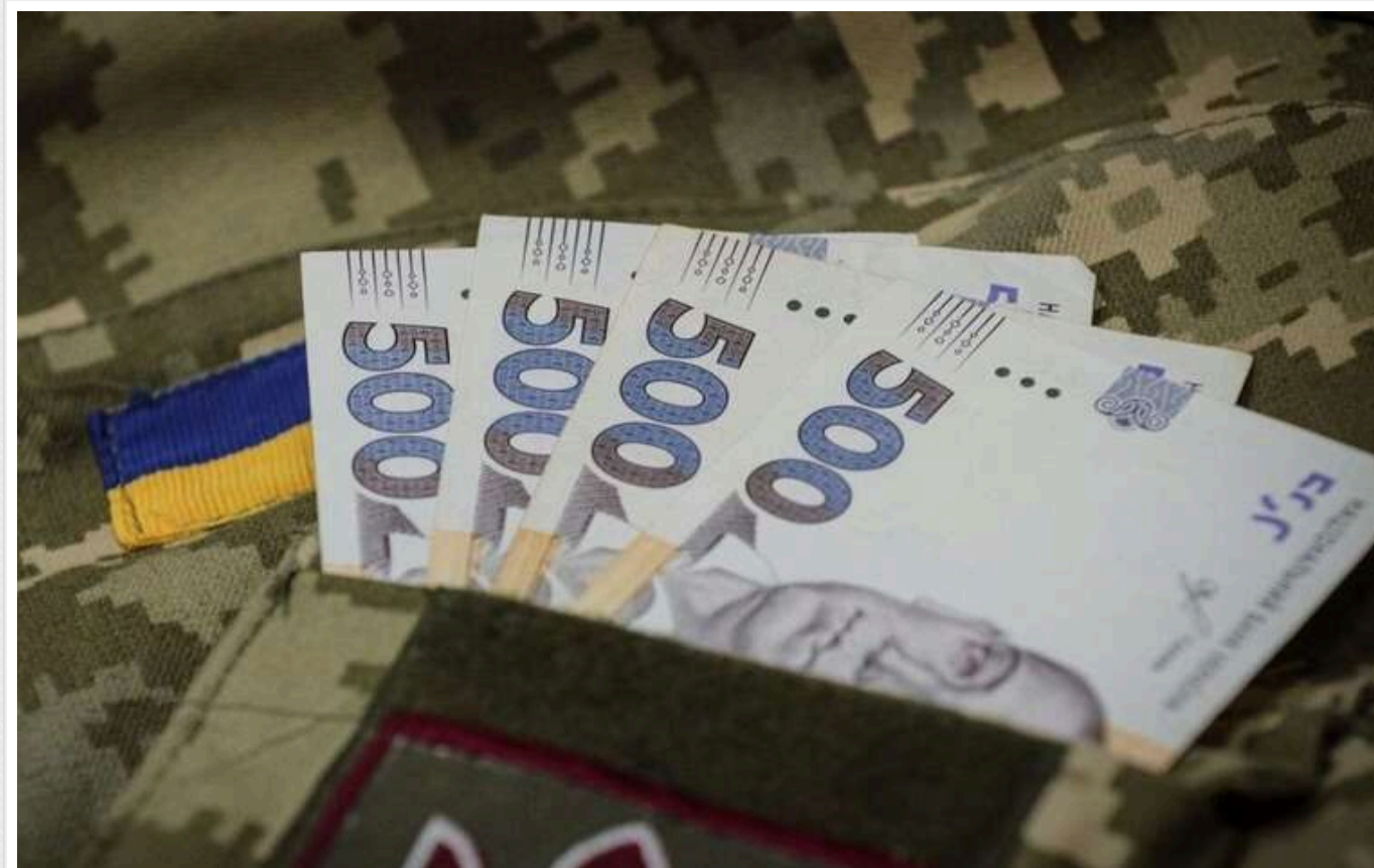
Сім'ї військовополонених можуть отримати до 100 тисяч гривень, - Мінреінтеграції

Українці мають право на отримання щорічної державної грошової допомоги в розмірі 100 000 гривень за кожен рік перебування їхніх родичів у полоні.