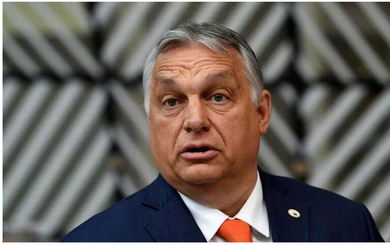
Орбан хоче зірвати надання допомоги Україні, — Politico

Якщо Брюссель і Вашингтон спільно погодяться на кредит, кандидат від Республіканської партії, якого можуть переобрати, буде пов'язаний з ним на довгий час. Але якщо виділення коштів Києву схвалять без США, у Трампа не буде такого зобов'язання.