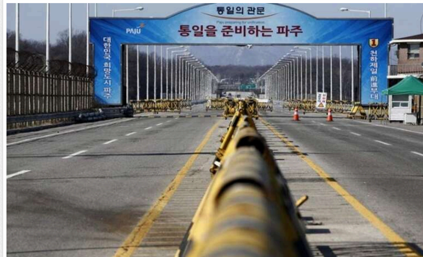
КНДР планує підірвати дороги, які ведуть до Південної Кореї

Ймовірно, Північна Корея сьогодні готується підірвати дороги на кордоні з Південною Кореєю.