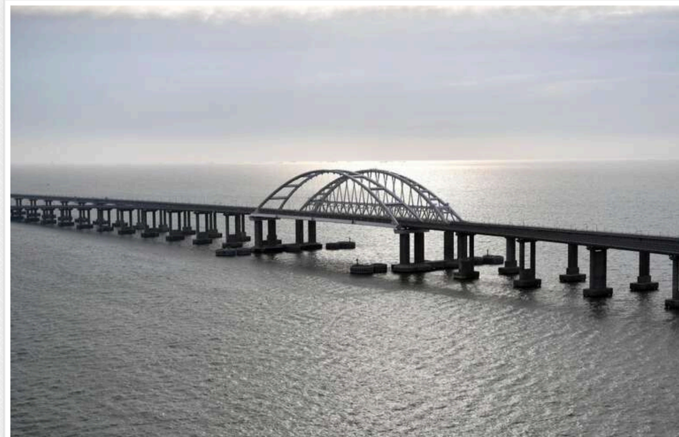
Бонові загородження не можуть захищати Керченський міст і плавають поблизу окупованої Керчі

Бонові загородження, якими Росія намагається захистити Керченський міст, що з'єднує окупований Крим з РФ, від можливих атак морських дронів ЗСУ, дрейфують в акваторії біля берегів Керчі.