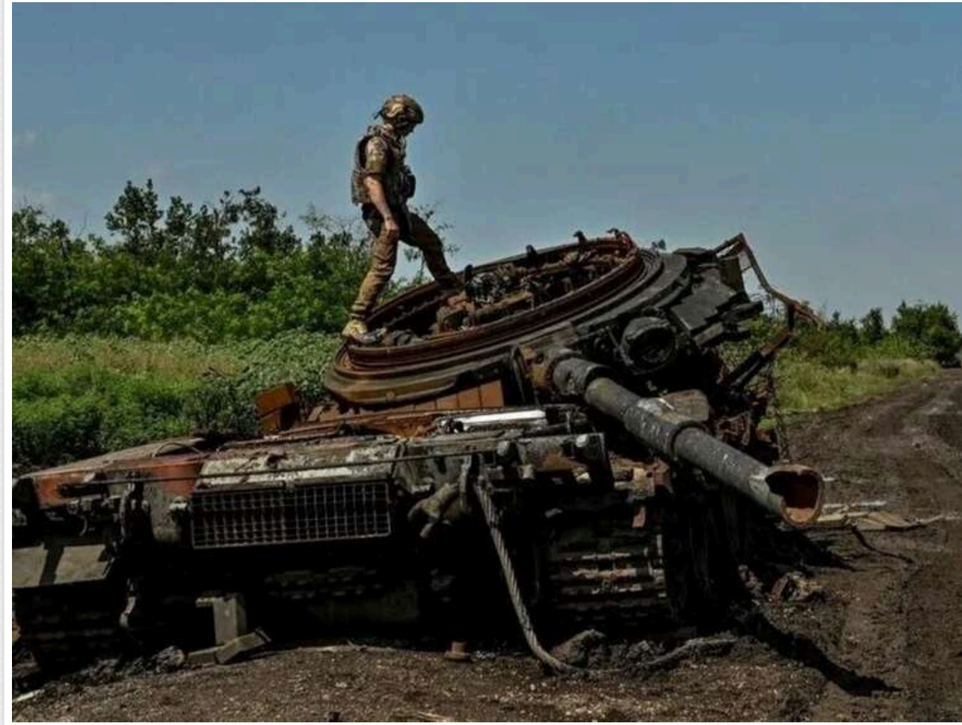
Втрати ворога за добу: відмінували 11 артсистем і 1260 окупантів

Українські оборонні сили протягом минулої доби знищили та поранили приблизно 1260 російських загарбників у бойових зіткненнях. На сьогодні загальні втрати особового складу російської армії у війні становлять 670 190.