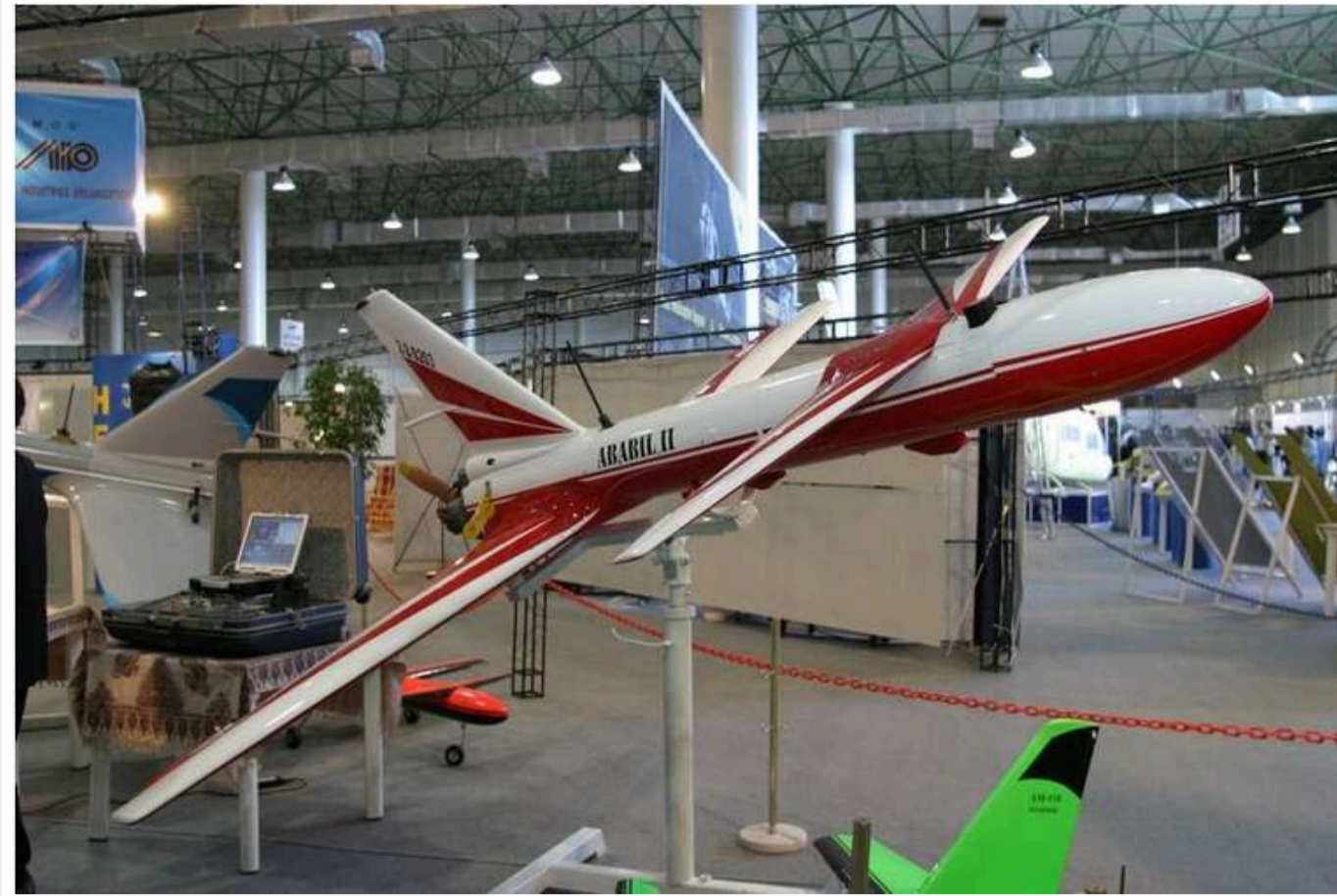
В Ізраїлі розповіли, які дрони використовувала "Хезболла" для удару

Бойові підрозділи "Хезболли" використали дрони-камікадзе Mirsad в атаці на Ізраїль напередодні ввечері. Один із безпілотною не вдалося збити, і він завдав удару по групі людей у районі Бін'яміна, що призвело до поранення майже сімдесяти осіб і загибелі чотирьох.