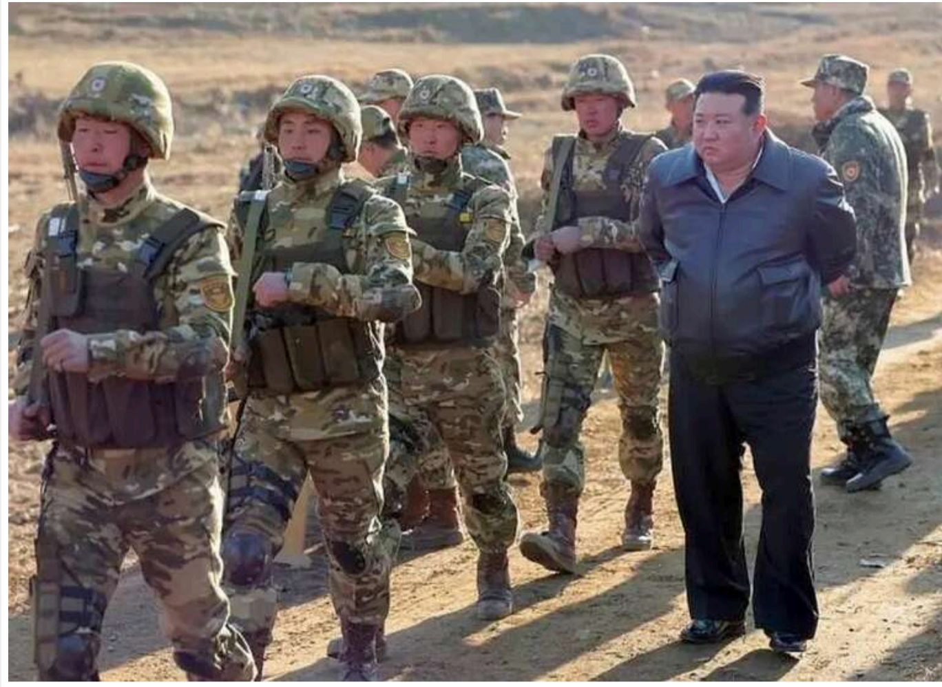
РФ може використовувати корейських військових для зміцнення власних кордонів, - ЦПД

Російська Федерація може залучити військовослужбовців КНДР для охорони свого кордону.