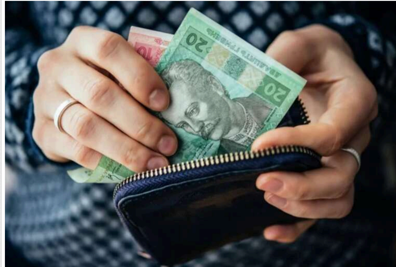
83% українців очікують на погіршення економічного становища в країні

Настрої щодо економічної ситуації у нашій державі серед українців досягнули історичного антирекорду.