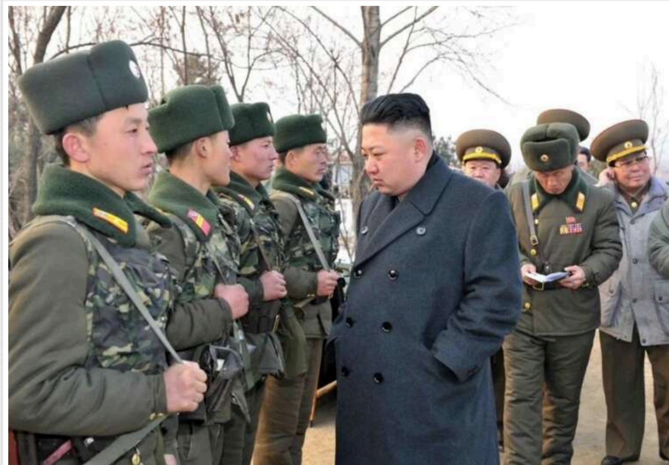
Військові КНДР облаштували полігон поблизу окупованого Маріуполя, – партизани

Партизани заявили, що докладуть максимум зусиль, аби до північнокорейських інструкторів якнайшвидше дійшов "привіт" від ЗСУ.