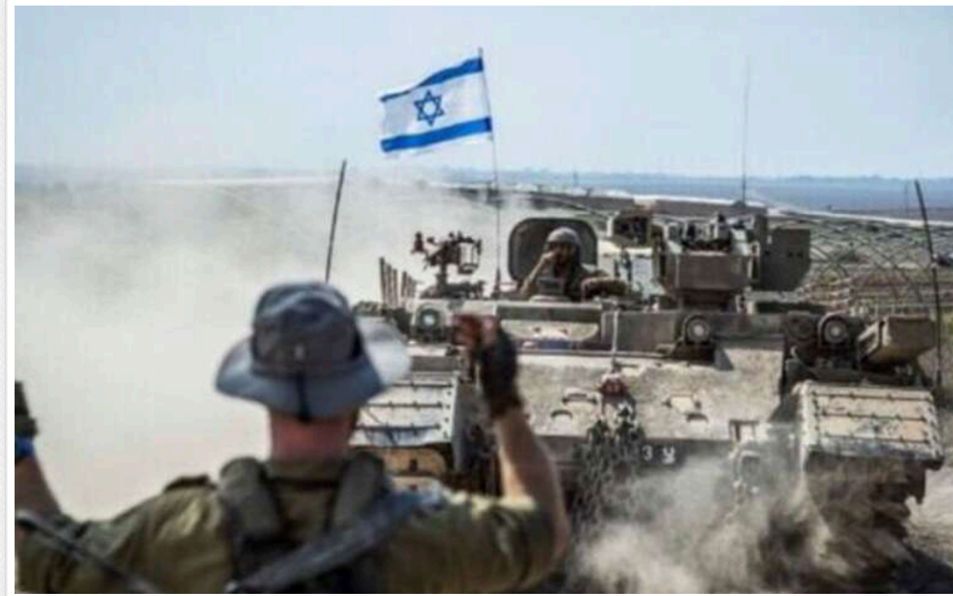
Ізраїль висунув вимоги для припинення своєї операції у Лівані, - ЗМІ

Про це повідомляє ізраїльський 12-й канал.