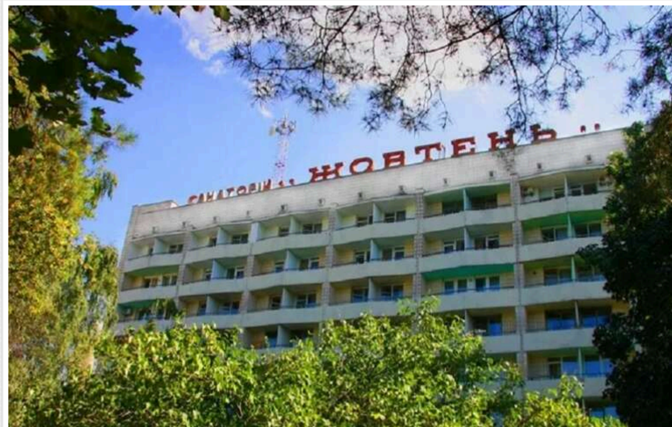
Кіпрська компанія стала власником заповідної території санаторію "Жовтень"

Непритімна кіпрська компанія з Лімасола стала власником 8 га заповідної території в елітному районі Конча-Заспа, де розташований профспілковий санаторій "Жовтень"