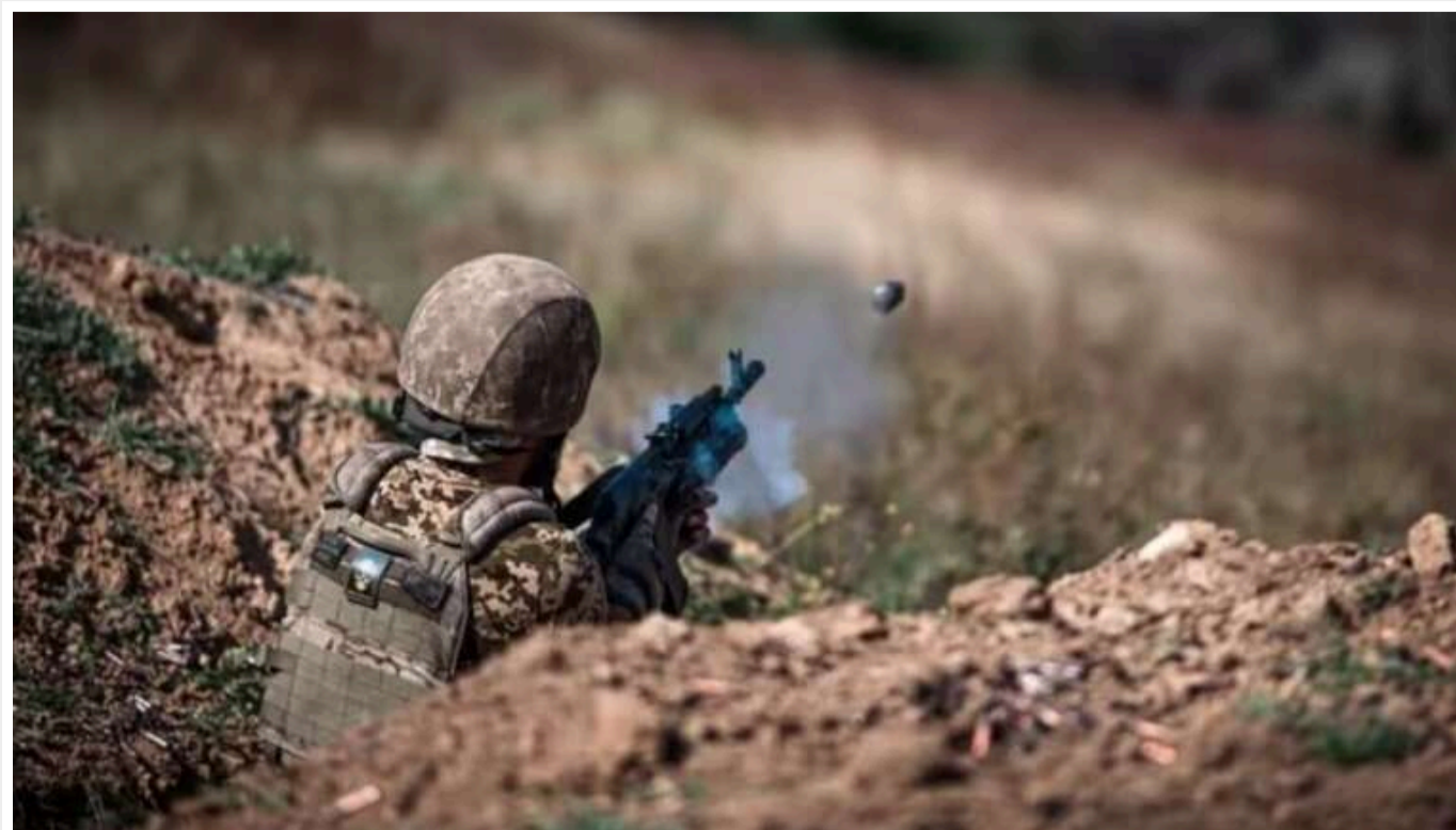
Ситуація на фронті: найгарячіше на Курахівському напрямку, всього на фронті відбулось 105 бойових зіткнень

У неділю на фронті сталося 105 бойових зіткнень, найінтенсивнішою залишається ситуація на Курахівському напрямку, ворог також активний на Лиманському, Покровському та Куп'янському напрямках.