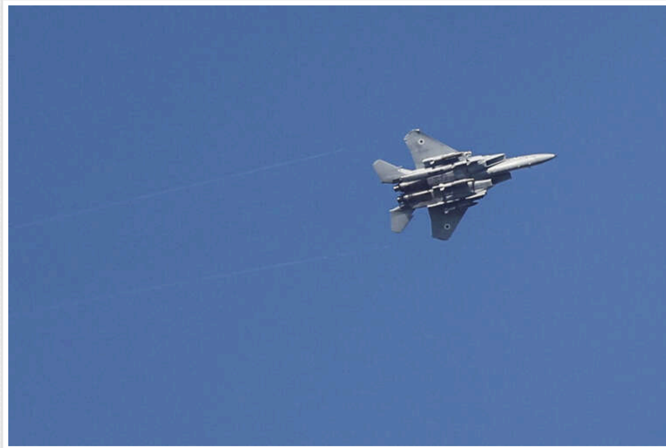
В останні три дні ЦАХАЛ не здійснював авіаудари по об'єктах "Хезболли" в Бейруті за розпорядженням влади країни

Про це повідомляють ізраїльські ЗМІ KAN 11 та Ynet.