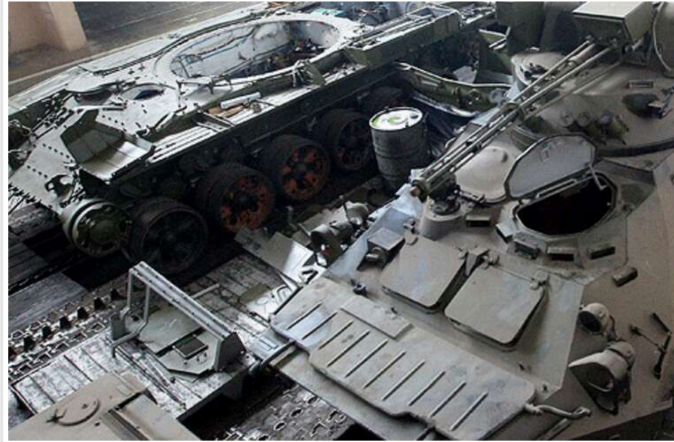
WP: Замість постачання зброї Євросоюз вкладає кошти в оборонно-промисловий комплекс України

ЄС вкладає кошти у підтримку оборонної промисловості України, щоб задовольнити її потреби у зброї в умовах російської агресії.