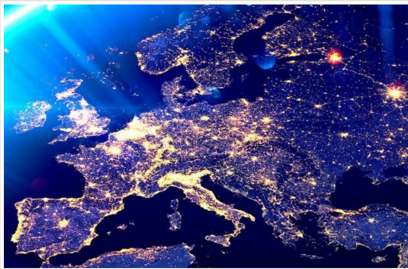
Bloomberg: Занепад Європи вже не зупинити

На думку видання, у ЄС «майже не залишилося часу, щоб зберегти своє місце у цьому жорсткому світі».