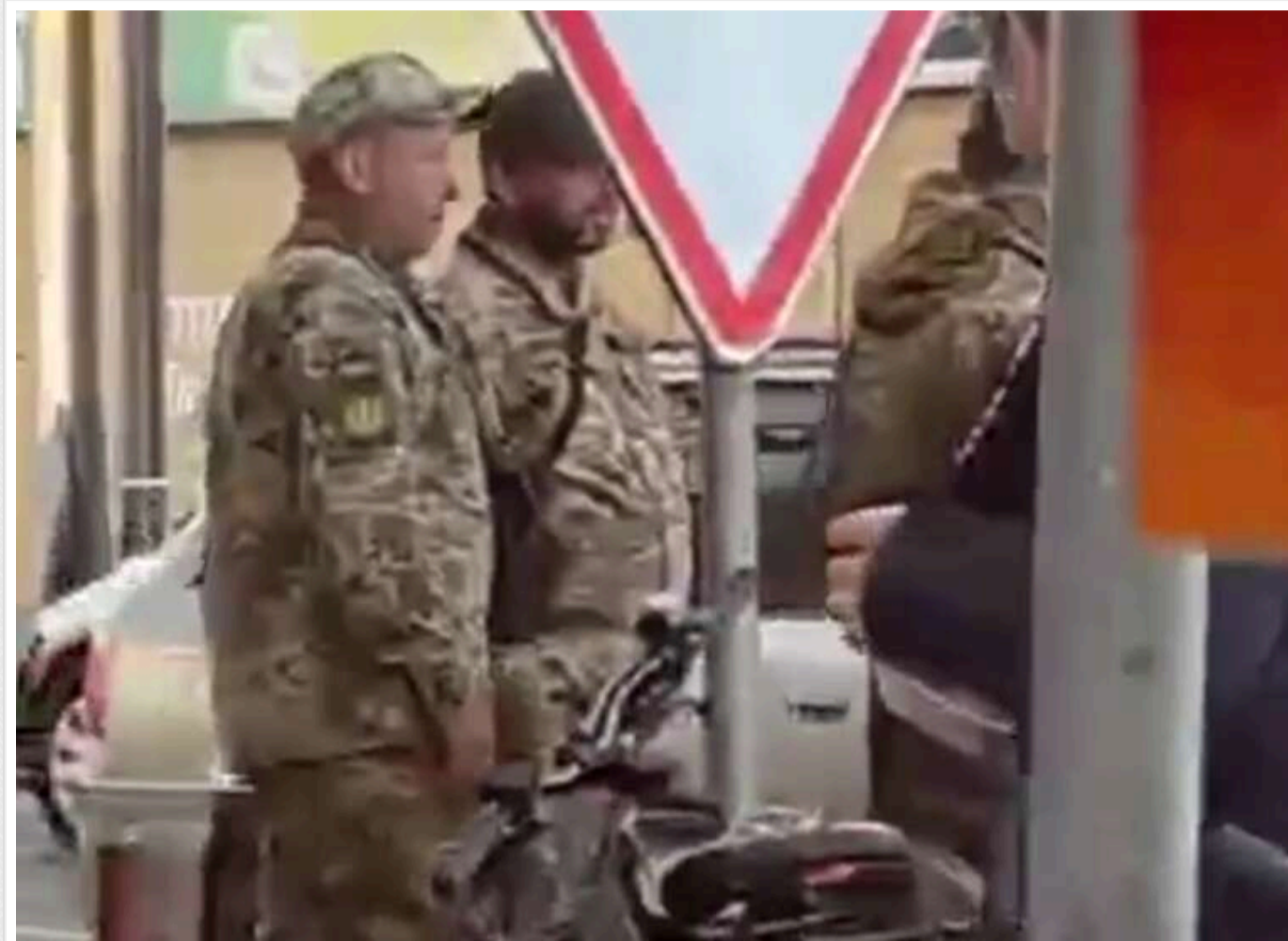
У Житомирі невідомий чоловік вирішив станцювати перед співробітниками ТЦК

Той момент, коли маєш право на відстрочку.