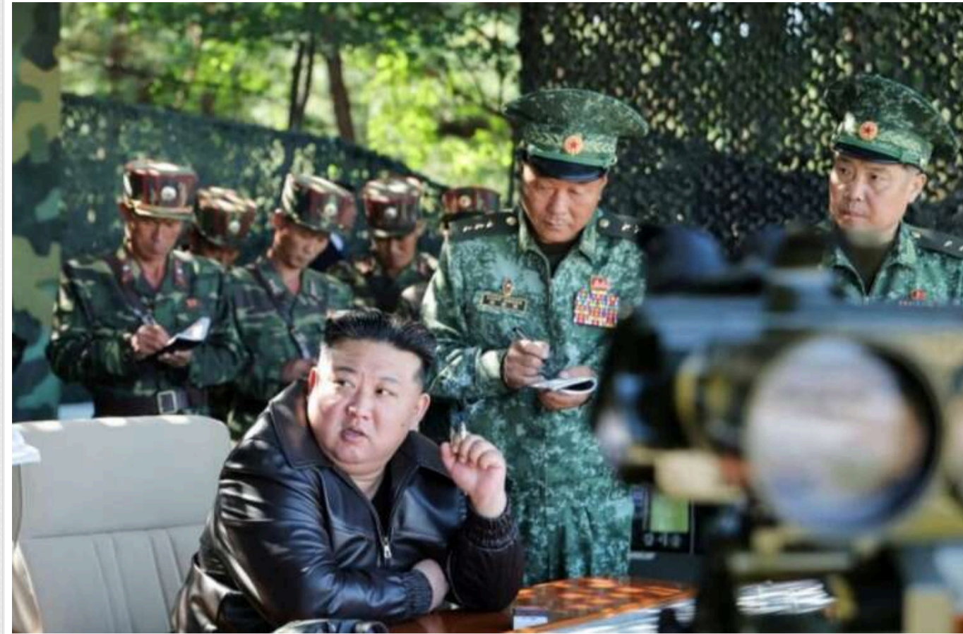
Артилерійські підрозділи Північної Кореї отримали наказ бути готовими відкрити вогонь по Південній Кореї

Про це пише Reuters , посилаючись на заяву уряду КНДР.