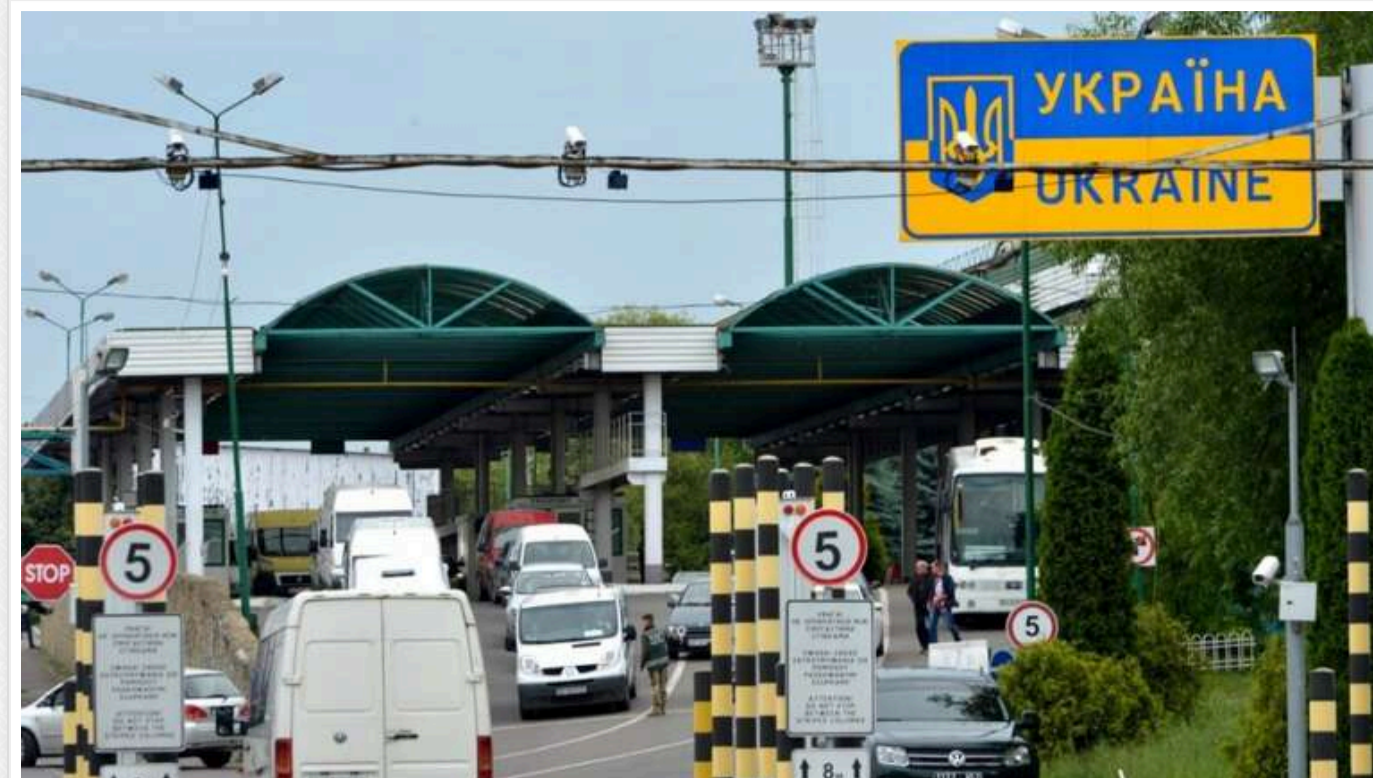
Мільйони з контрабанди, але ні копійки на ремонт: Хто винен у занедбаних дорогах «Шегині»?

Так виглядає обличчя України в пункті пропуску «Шегині» на кордоні з Польщею.