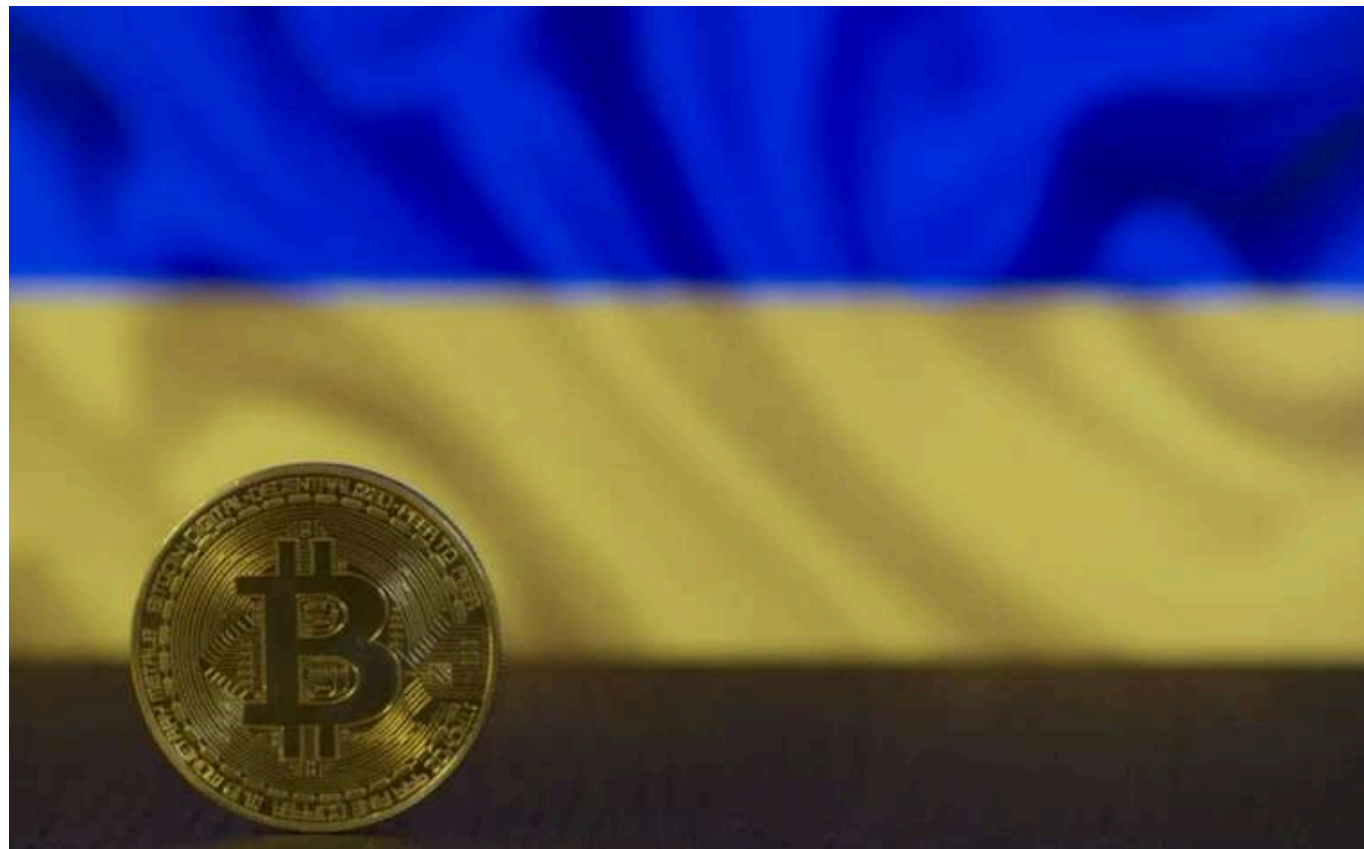
В Україні у 2025 році планують легалізувати криптовалюту

В Україні планують легалізацію криптовалюти, що може статися в першій половині 2025 року. Законодавство передбачає стандартне оподаткування інвестиційного прибутку, без податкових пільг для операцій із криптовалютами.